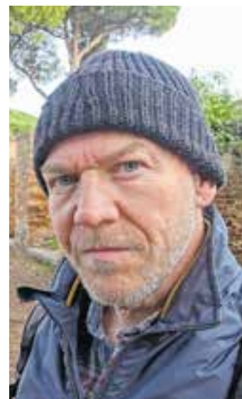
«Es gibt kein Pro und Kontra in dieser Frage»: Regisseur Horat.

Zwar ist der Dreh- und Angelpunkt in der Wolfsdebatte die menschliche Urangst vor der Bestie. Doch der Widerstand