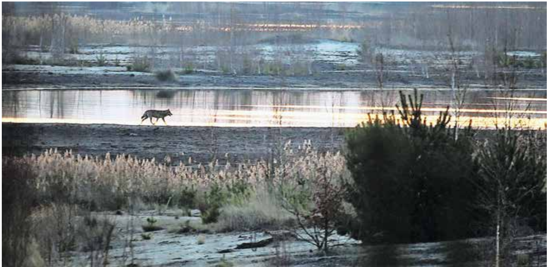
Seltene Aufnahmen, wie auf diesem Bild aus der Lausitz in Deutschland. In «Die Rückkehr der Wölfe» gibt es mehrere davon, auch spektakuläre.

Dieser Zwiespalt prägt denn auch die Wolfsdebatte in der Schweiz: Auf der einen Seite steht die wichtige Rolle, die der Wolf in der Natur einnimmt, weil er mit seiner Jagd auf Rotwild den Wald schützt. Auf der anderen Seite fürchten wir uns, wie Rotkäppchen gefressen zu werden. Zwar liegt dieses Risiko in Europa und Nordamerika nahe bei null. Doch das Restrisi-